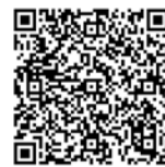
成約登録マニュアル