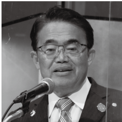
大村 秀章 愛知県知事