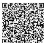
あいぼっぼ掲示板マニュアル

また、「あいぼっぼ掲示板」「あいぼっぼ×リアプロ連携」も絶賛稼働中です。 使用マニュアルについては下記のQRコードからご覧ください