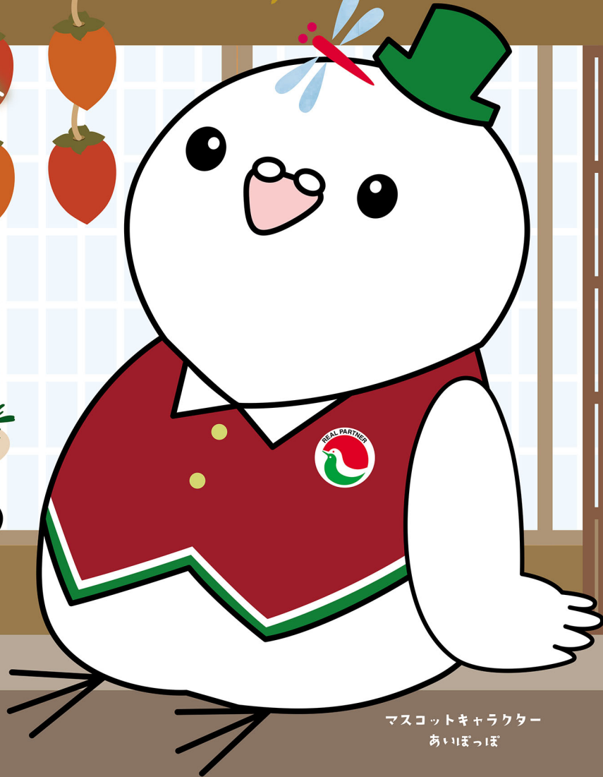
マスコットキャラクター あいちぽぽ