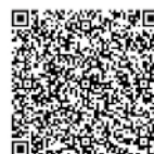
あいぼっぼ×リアプロ連携