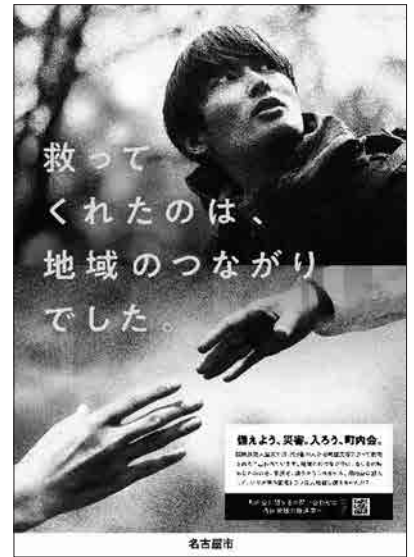
新たに作成した町内会・自治会PRポスター

いざというときにお互いが助け合えるように、また、より住みよいまちをつくるために、くらしや住まいに関わりの深い愛知県宅地建物取引業協会の皆さまには、こうしたポスターや冊子等を店頭などで掲示、配布いただくなどご協力をお願いいたします。ご協力いただける場合は、必要部数をお送りさせていただきますので、ぜひ、ご連絡ください。