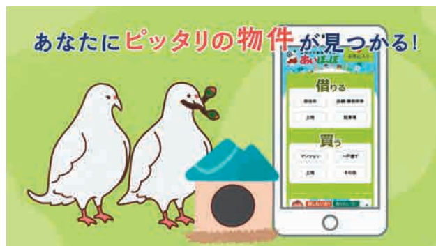
9月は「不動産流通サイト あいぽっぽ」PRバージョン