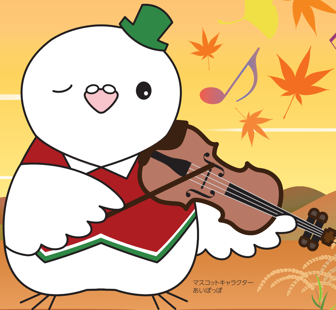
マスコットキャラクター あいぽっぽ