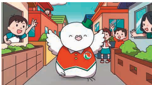
8月は「愛知県宅建協会」PRバージョン