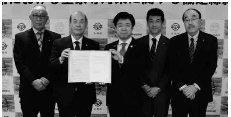
左から宅建サポート大高社長、岡本会長、山下市長、銅谷北尾張副支部長、米山北尾張支部長