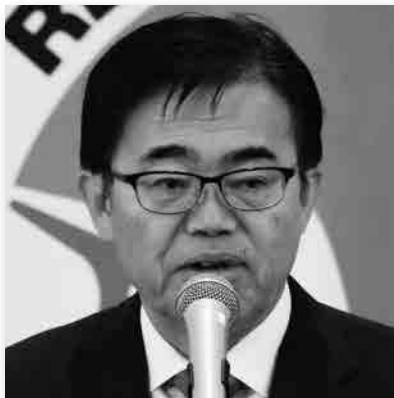
大村 秀章 愛知県知事