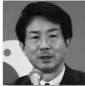
大塚 耕平 国民民主党代表代行 参議院議員

さらに、歓談中、公務多忙の中、本新年会に駆けつけて頂いた、大村秀章愛知県知事より、「実は先ほど、フランスから戻り、そのままこちらに参りました。なぜ、フランスに行っていたかですが、鶴舞公園の南に昔の県の勤労会館がありました、あそこに延床3万㎡規模のスタートアップ、昔はベンチャー企業と言いましたが、その拠点を作ろうということでプロジェクトをどんどん進めております。その一つのモデルがパリにステーションFという世界で最も成功したスタートアップの拠点施設があります。そこは世界中から連携しようとオファーがきているものを全部断っていますが、日本で愛知とだったらやると言っていたら、去年8月も行ってきましたが、今回も直接話をし、プレゼンをやって協議をし、前向きに提携しようということで口頭では合意をさせていただきましたので、後はどういう形でやっていくかをこれから進めていきたいと思っております。