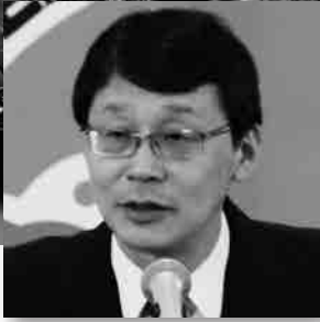
堀場 和夫 名古屋市副市長