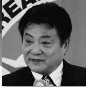
丹羽 ひろし 名古屋市会議長