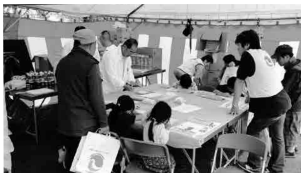
支部地域事業の様子

豊橋市・豊川市・新城市・田原市などは企業誘致に注力しており、豊川市には大型ショッピングセンターの建設も予定されており、こちらも今後期待が持てます。