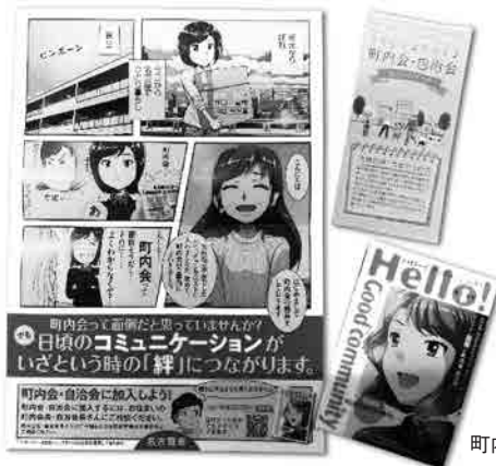
町内会・自治会PRポスター・リーフレット・漫画

また、東日本大震災 や阪神・淡路大震災、 東海豪雨などでは、 町内会・自治会を通 じて近所づきあいの あるところほど、地域 による救助が進み、 復旧も早かったと言 われています。