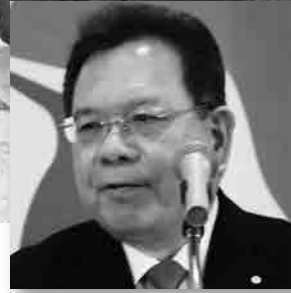
酒井 庸行 自民党愛知県支部連合会副会長 参議院議員