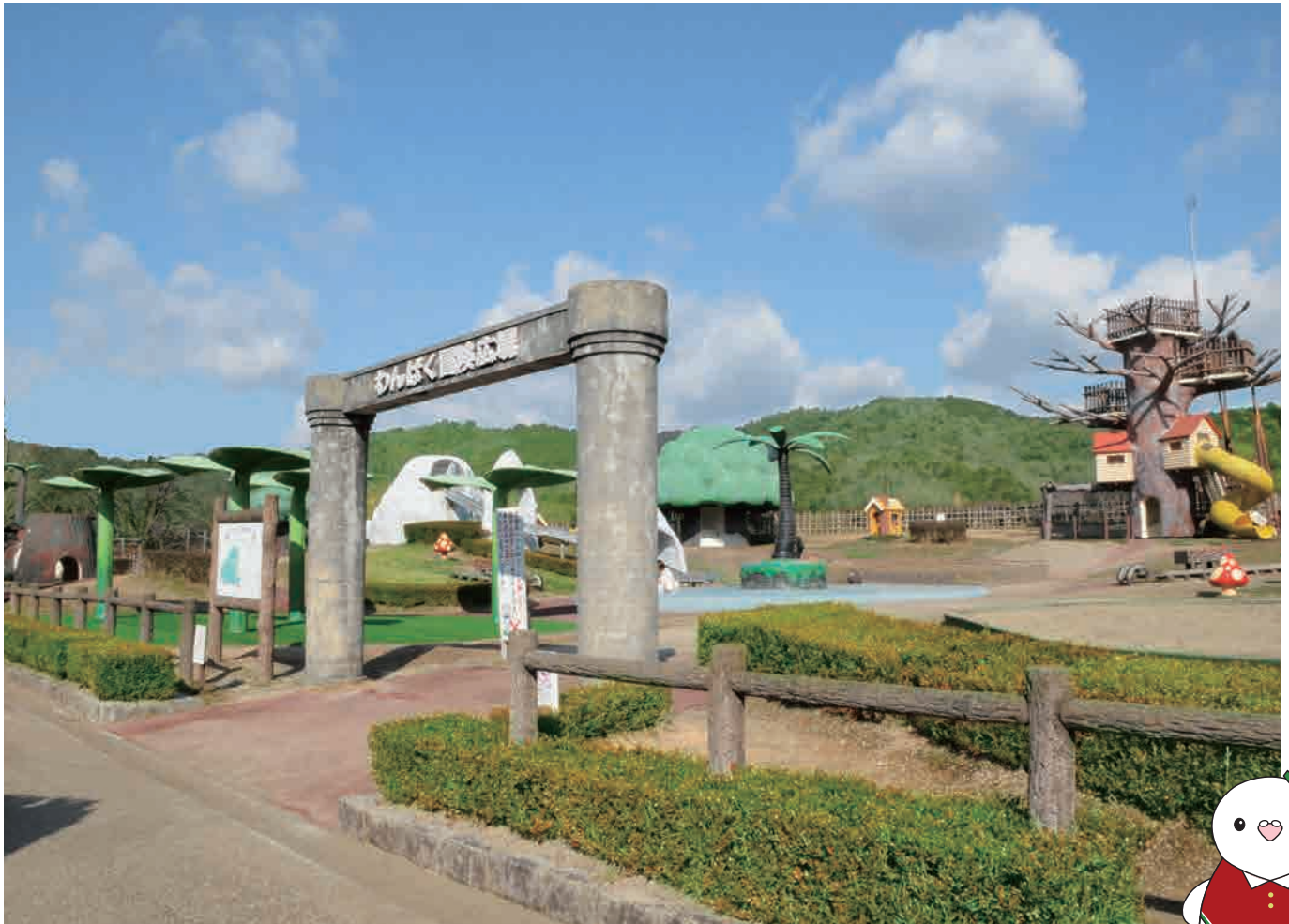
愛知の風景「小牧市民四季の森」(北尾張)