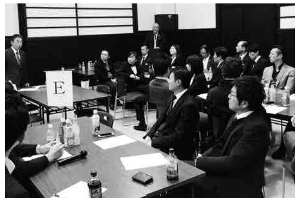
意見交換・交流会の様子