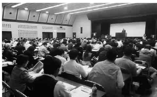
支部研修会の様子

また、各地域事業や支部総会等の機会に募金活動を行い、それをもとに毎年、市民病院へ車椅子の寄贈や地域の乳児院への寄付を行っています。その様子は新聞やケーブルテレビを通して報道され、宅建協会のイメージアップに少なからず寄与しているものと自負しております。