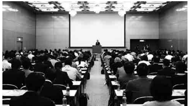
昨年度の賃貸管理業実務セミナーの様子

また、本セミナー後には、(一社)全国賃貸不動産管理業 協会の会員及び入会を検討している方を対象とした意見 交換・交流会を開催しますので、お気軽にご参加下さい。