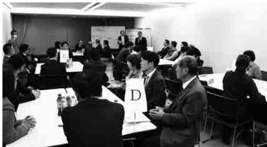
昨年度の意見交換・交流会の様子

愛知に本社を構える創業35年の管理会社 にて実際に取り組んでいる賃貸オーナーへの 支援を公開。宅建業者・賃貸管理者だから こそできる相続・不動産対策で「建物管理」 から「資産管理」へ体制を整えるためのヒント を充実の資料とともに提供。