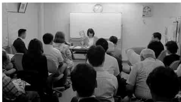
支部勉強会の様子

また、他支部訪問を参考に実務に役立つ勉強会を定期的実施し、毎回満席になるなど会員に好評を得ております。地価動向調査についても地価動向調査特別委員会として幹事以外の会員にも協力を求め、活発な議論の中で適正な価格割り出しに努めています。最大事業である新年会は今年創立20周年記念式典を併せて開催しますので、支部が一丸となり、現在取り組んでいるところです。