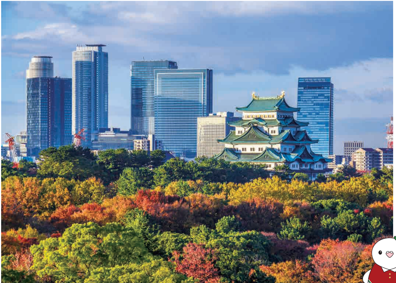
愛知の風景「名城公園と名古屋城、高層ビル群」(名城)