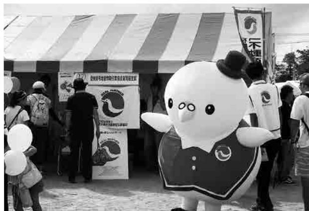
支部地域事業の様子

瀬戸市では若い陶芸家の方々が空き家を利用し、自身の工房を置くなど、既存住宅の流通も活発に行われております。