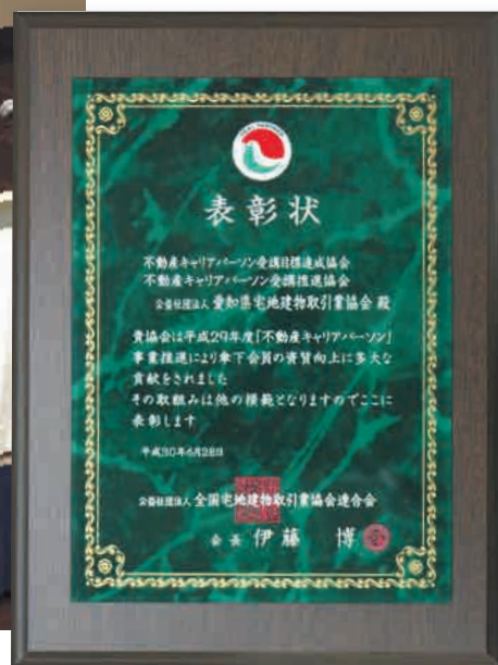
不動産キャリアパーソンの表彰盾