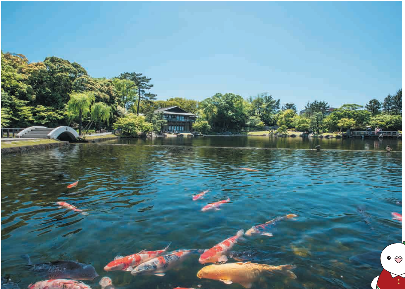
愛知の風景「徳川園」(名城)