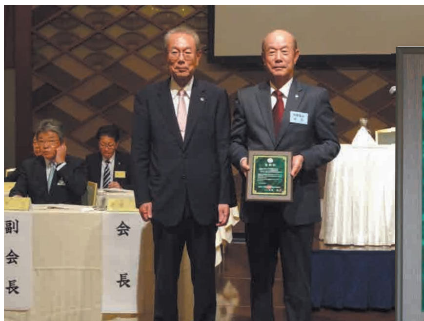
不動産キャリアパーソン表彰風景

議事に先立ち表彰が行われ、本会は教育研修制度「不動産キャリアパーソン」の「受講目標を達成した協会」として、5年連続で表彰を受けました。(受講者数:753名(目標数:574名))