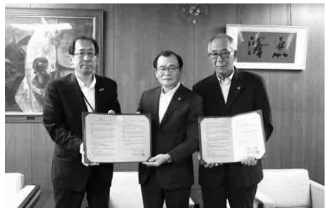
左から 成瀬町長、梅田副会長、宅建サポート 大高社長・西三河支部長

これで提携している自治体は15自治体です。(平成30年8月2日時点) 15自治体は下記の通りとなります。