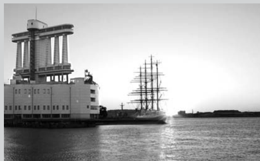
名古屋港からの日の出(名南西)