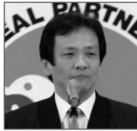
藤沢ただまさ 名古屋市会議長