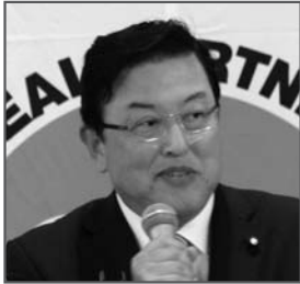
長坂康正 衆議院議員