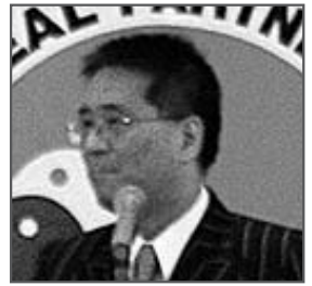
伊藤忠彦 衆議院議員