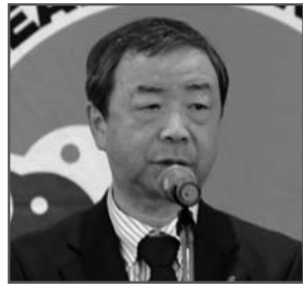
田宮正道 名古屋市副市長