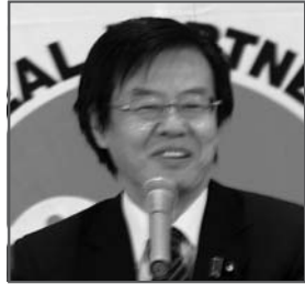
大見正 衆議院議員