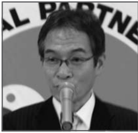
大野雄一 国土交通省 中部地方整備局副局長